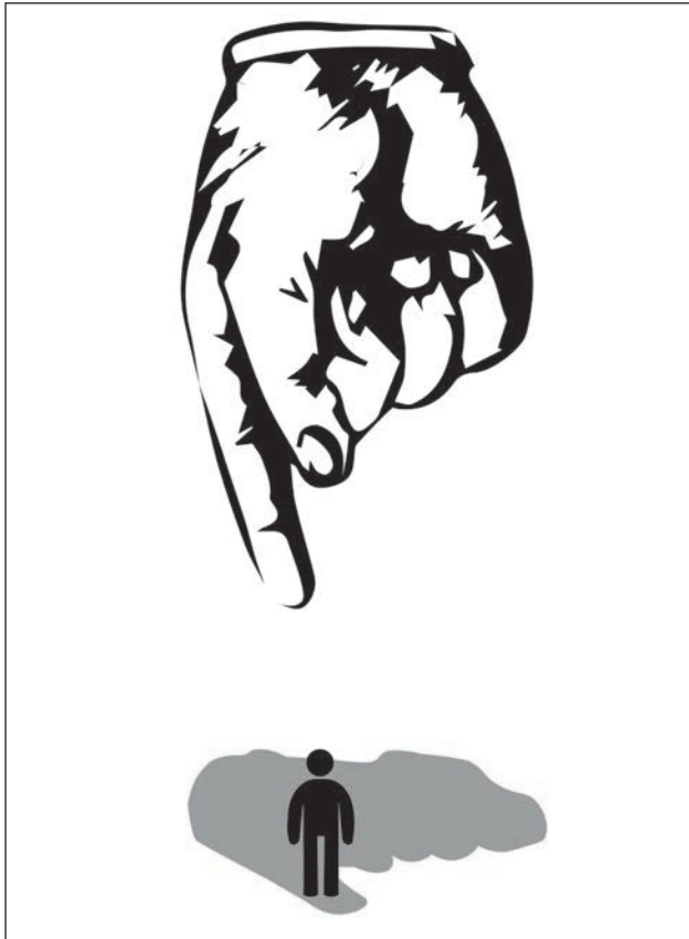
Figura 1. Referente a la presunción de inocencia