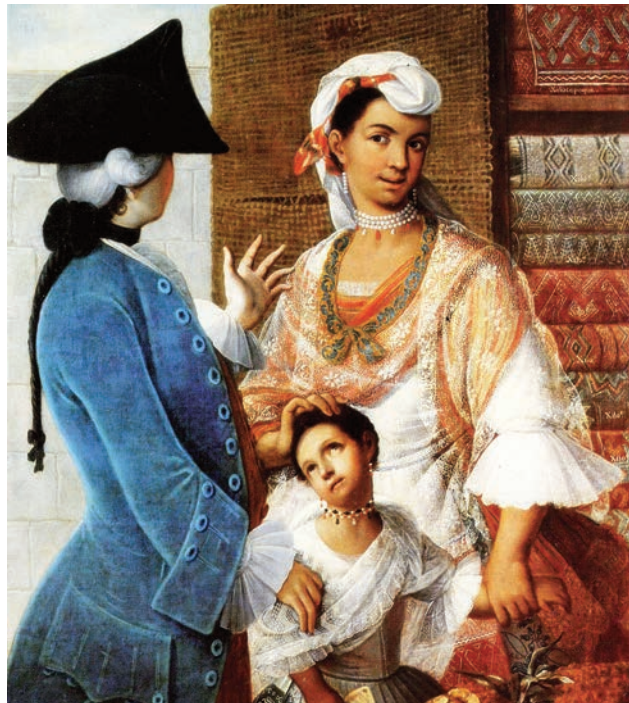
Fragmento del cuadro de Miguel Cabrera, año 1763, ubicación Museo de Madrid, España.

Calpamula , el descendiente de padres de distintas razas, especialmente de albarazado y negra, o de negro y albarazada.