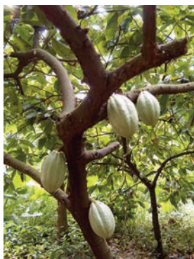
Fotografía tomada en la zona arqueológica de Comalcalco, Tabasco, México, situada a los 18° 16' 26" latitud Norte y a los 93° 17' 43" longitud Oeste, a una altitud de 20 MSNM.