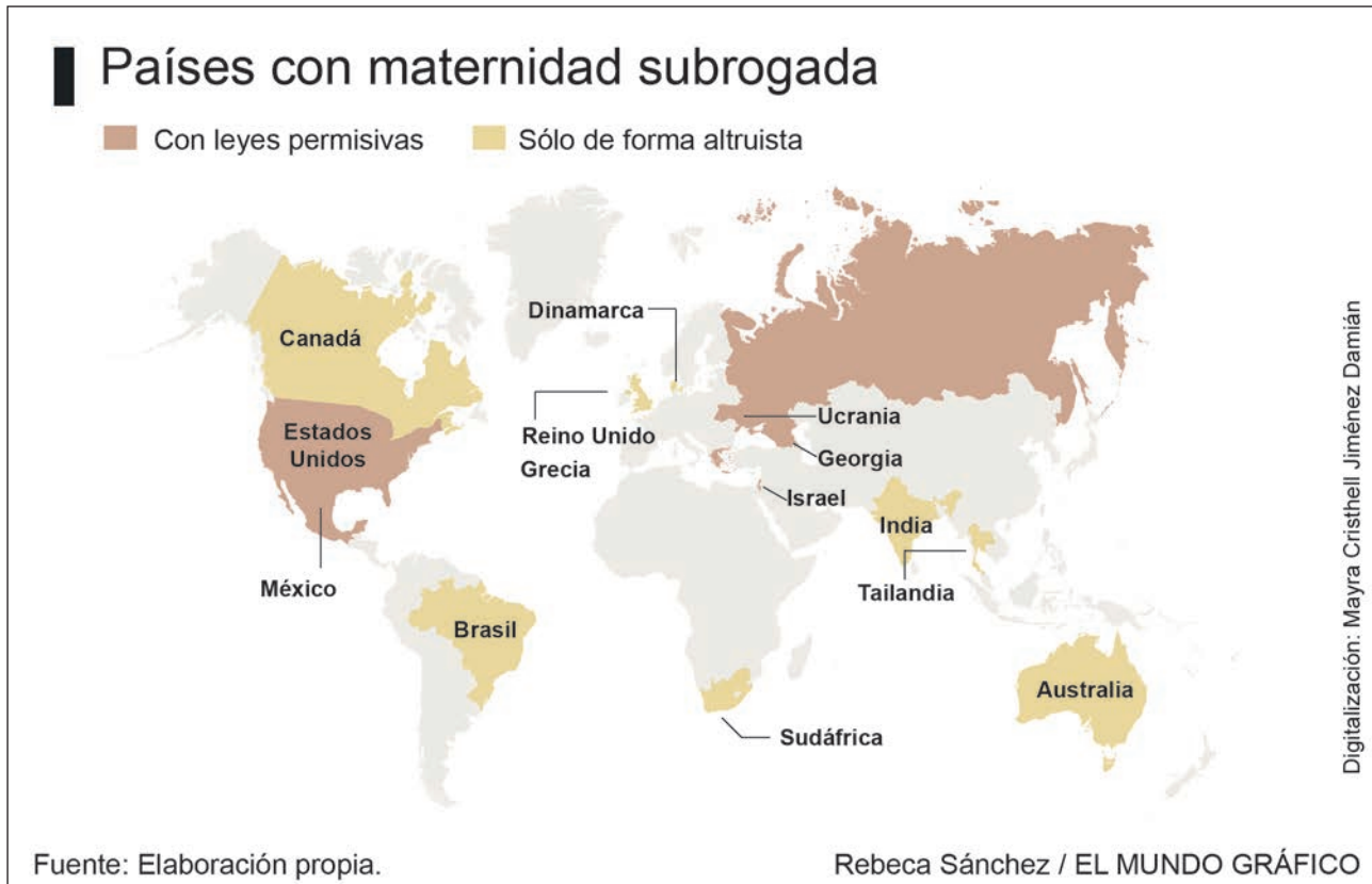
Figura 1. Países con maternidad subrogada.

que participan dos mujeres que presumen ser madres de un bebé. Esta causa es por lo que resulta importante determinar qué es la maternidad, a fin de definir si las dos mujeres que se encuentran involucradas en la maternidad subrogada son las madres del bebé, o lo es sólo una de ellas.