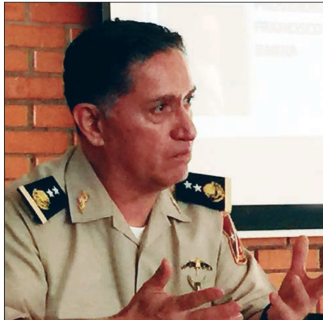
El general de brigada D. E. M. Jorge Andrade Ramírez, comandante de la 30ta. Zona Militar.

Cabe mencionar que en un marco de colaboración el Ejército y la Fuerza Aérea trabajan estrechamente con otras instituciones gubernamentales y participan activamente en el combate al narcotráfico y la delincuencia organizada, a fin de realizar, de manera más efectiva, las operaciones de búsqueda, localización y destrucción de plantíos, centros de acopio, laboratorios y pistas de aterrizaje clandestinas, así como la intercep-