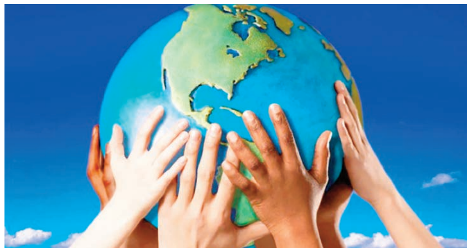
Figura 2. Todos unidos en defensa de los derechos universales